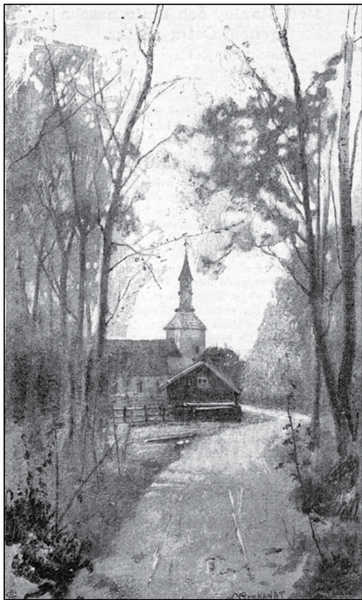
Nya kyrkan på Visingsö.