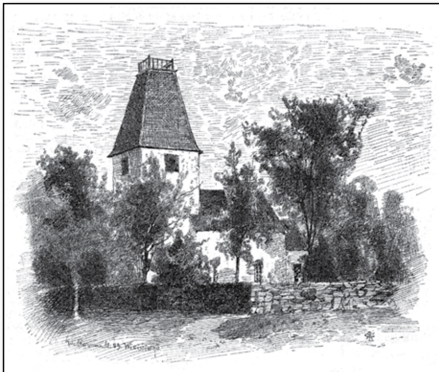
Kumlaby kyrka på Visingsö. "Grefve Pers gymnasium".