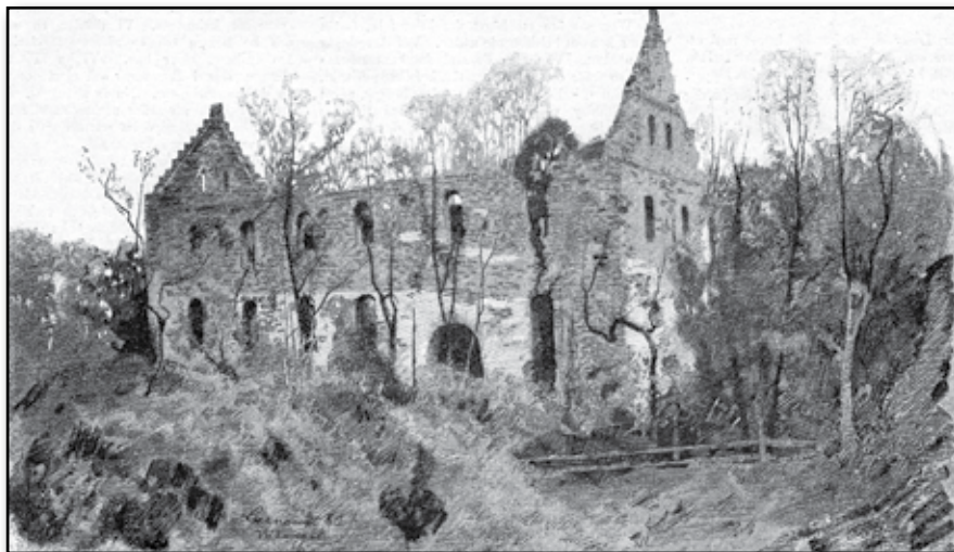
Borgruinen på Visingsö.