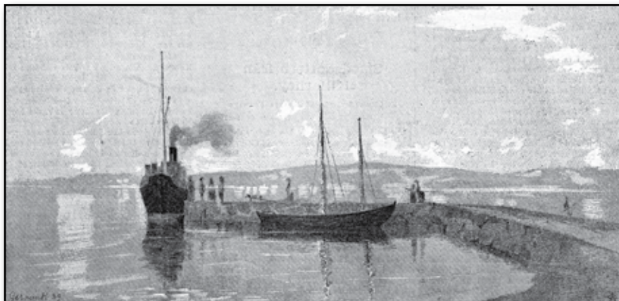
Hamnen på Visingsö i morgonbelysning.