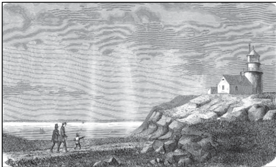
Fyrtornet på Kullen i Skåne.