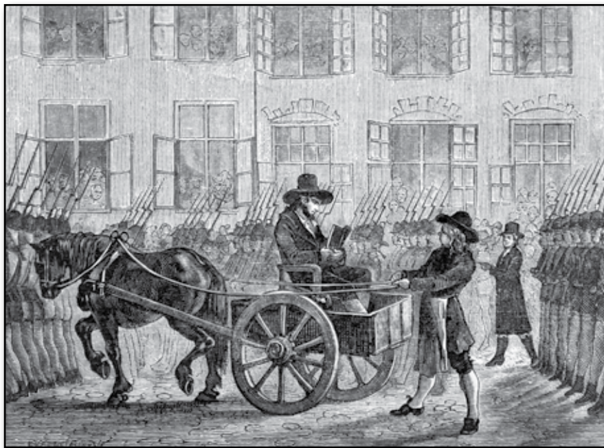
Anckarström utföres till afrättsplatsen.